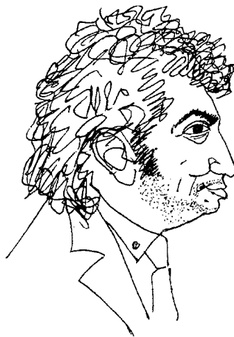
(Академически закачки. Рисувани и римувани шаржове. Изд. „Фабер“, В. Търново, 2000)

РУ „А. Кънчев“. (...И оставам жив. Стихове и размисли. Русе, 2007)